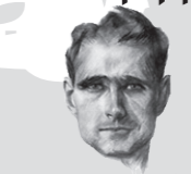
Märtyrer für Deutschland